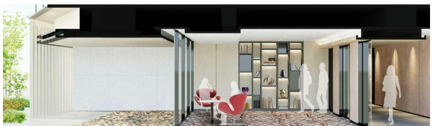
ビジネスラウンジ