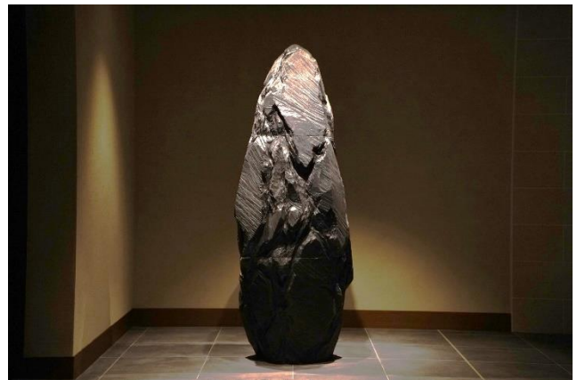
彫刻の森美術館監修のアート作品