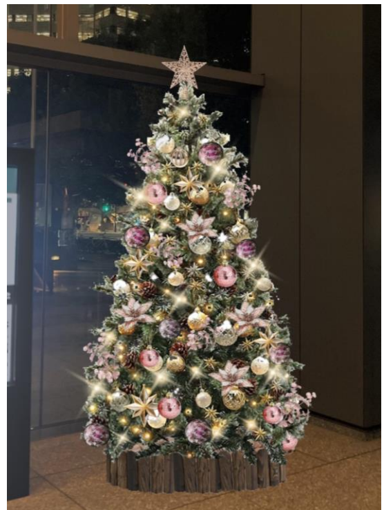
1F アトリウム メインツリー(イメージ)