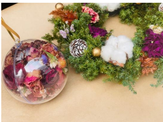
エシカルフラワー オーナメント(イメージ)