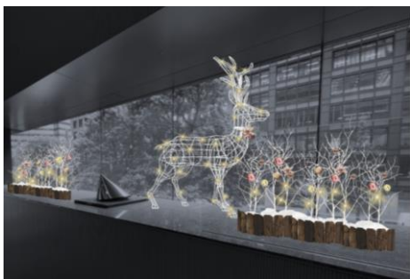
2F 窓側装飾(イメージ)