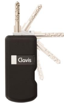
ハンズフリーキー