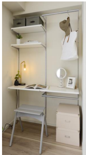
洋室 (A タイプ)