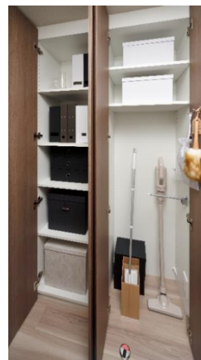
収納 (C タイプ)

当社は今後もひとつひとつ丁寧な開発を行い、都市に暮らす人々の生活利便性や、働き方・暮らし方の多様性に応えるために、さまざまなスタイルの住居を提供することで、人々が安心して住み続けられるまちづくりに取り組み、社会貢献を意識した開発に取り組んでまいります。なお、本リリースの取り組みは SDGs（持続可能な開発目標）における3つの目標に貢献しています。当社は、持続可能な社会の実現に貢献してまいります。