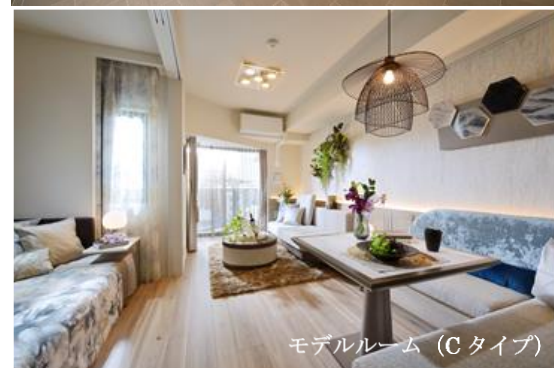
モデルルーム (Cタイプ)