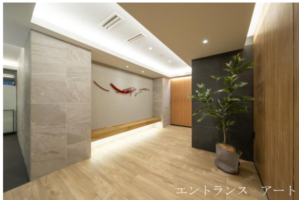
エントランス アート

エントランスホールには、公益財団法人彫刻の森芸術文化財団が監修したアートに加え、BGMや地元のインテリアショップで取扱うアロマを設置。各フロアの内廊下にもアート作品をご用意し、ホテルライクで落ち着いた豊かな共用空間を提供します。