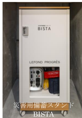
災害用備蓄スタンド BISTA

ルフォンプログレ専用カスタマイズした「災害用備蓄スタンドBISTA」を導入いたします。非常用発電機にスマートフォン10台の同時充電が可能な充電器、LEDランタンや女性用のサニタリーグッズ等を備蓄し、有事の際に安心して過ごせるように備えています。