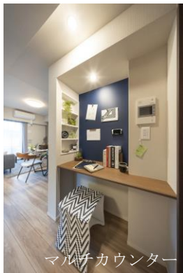
マルチカウンター

デスクや家電置場などマルチに使用できるカウンターや可動棚に加え、全住戸内に無料で利用できるWi-Fi設備を設置。また、機能的な収納設備、天井照明や姿見鏡など、在宅ワークと快適な暮らしを両立できる住まいを実現しました。