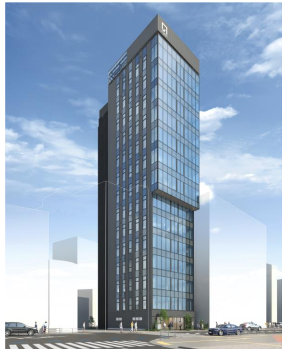
(仮称)S-GATE FIT 天神南 外観 (イメージ)