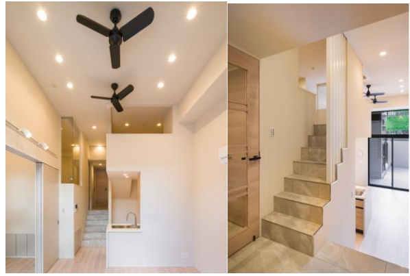
2LDK：プログレ初のロフト有、天井高 3.8m の開放的な大空間。