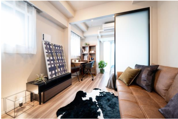
1DK：可動式間仕切りでプライベートスペースを分ける

賃貸レジデンスブランド「LEFOND PROGRÈS (ルフォン プログレ)」シリーズは、多様な働き方を実現できる住まいを目指しております。また、プログレ初のロフトや内階段を設置し、1K (25.05㎡) ~2LDK (55.65㎡) 全11タイプの多彩なルームプランを設け、都心勤務のビジネスパーソン及び近隣医療機関に勤める方など幅広い層のお客様にお勧めです。