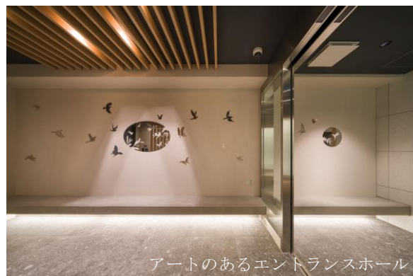
アートのあるエントランスホール