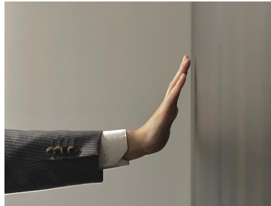
エレベーター非接触操作 (イメージ)