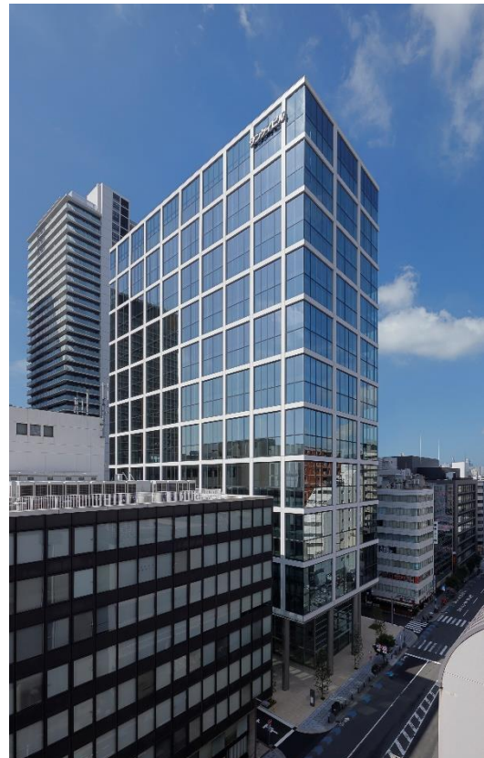
本町サンケイビル 外観

サンケイビルは、今後も、新しい時代に対応したオフィスビルづくりにチャレンジしてまいります。