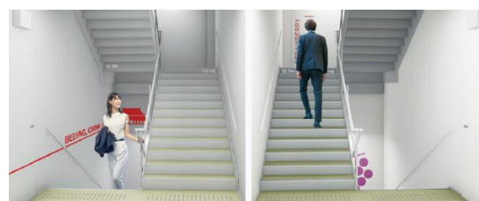
上りたくなる階段