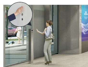
エレベータータッチレスボタン