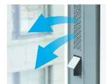
自然給気スリット