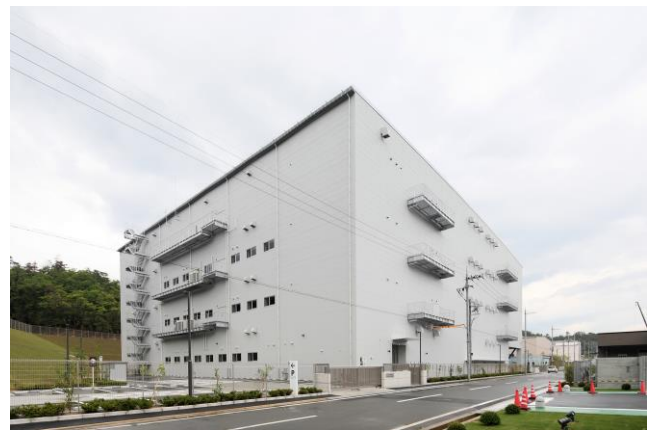
(仮称)箕面森町物流施設 外観

今後も収益性の高い魅力ある不動産商品の開発を行い、様々な投資家ニーズに応えてまいります。