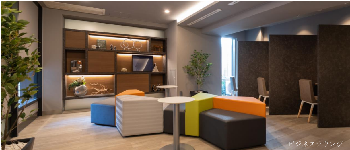
ビジネスラウンジ

賃貸レジデンスブランド「LEFOND PROGRÈS（ルフォン プログレ）」シリーズは、多様な働き方を実現できる住まいを目指しております。本物件では先行してビジネスラウンジを設置している2物件の入居者へのアンケートに基づき、「他人の視線を気にせずに作業が出来る個別ブース」「小さなPCでの作業効率をアップさせる大型モニター」「小休憩のための共用部トイレ」「気になる雑音を緩和するためのBGM」を設置し、より快適なビジネスラウンジを開発しました。