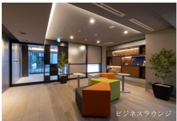
ビジネスラウンジ

当社は今後もひとつひとつ丁寧な開発を行い、都市に暮らす人々の生活利便性や、働き方・暮らし方の多様性に応えるために、さまざまなスタイルの住居を提供することで、人々が安心して住み続けられるまちづくりに取り組み、社会貢献を意識した開発に取り組んでまいります。