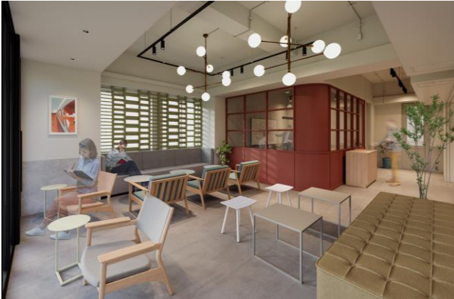
▲GLEAMS AKIHABARA ラウンジイメージ

充実した共用部を備えることで、専有部をワークスペースとして最大限に活用いただけます。