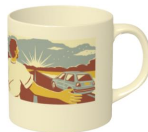
▲オリジナルマグカップイメージ