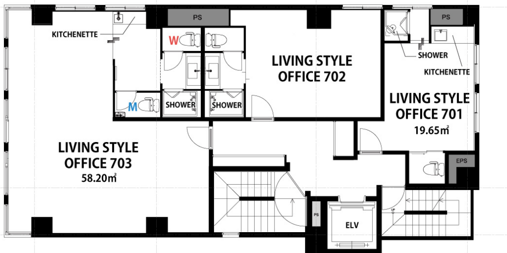
▲GLEAMS AKIHABARA 7階フロア MAP