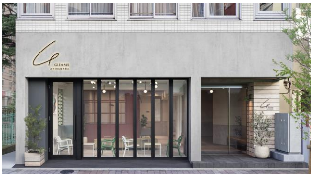
▲GLEAMS AKIHABARA 外観イメージ