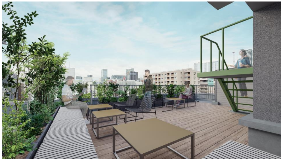
▲屋上 スカイテラスイメージ (GLEAMS AKIHABARA に設置)

GLEAMS AKIHABARA の屋上は、神田川を展望するスカイテラスヘリノバージョン。デッキの上にソファとチェアが並ぶ、グリーンに囲まれたオープンエアな空間です。1階ラウンジとの使い分けにより、社内ミーティングや仕事合間のリフレッシュ、ランチスペースとしてご利用いただけます。リラックスできる空間で、新たなアイデアや社内外のコミュニケーションを自然と引き出す魅力的なスポットです。入居者による貸切利用も可能なため、社内レクリエーションの場としても最適です。