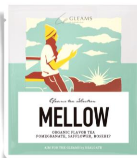
▲グリーンスオリジナルパッケージイメージ