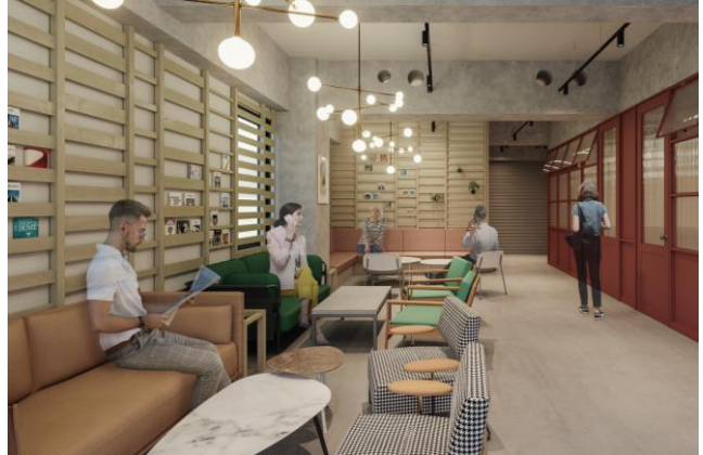
▲GLEAMS NIHONBASHI ラウンジイメージ