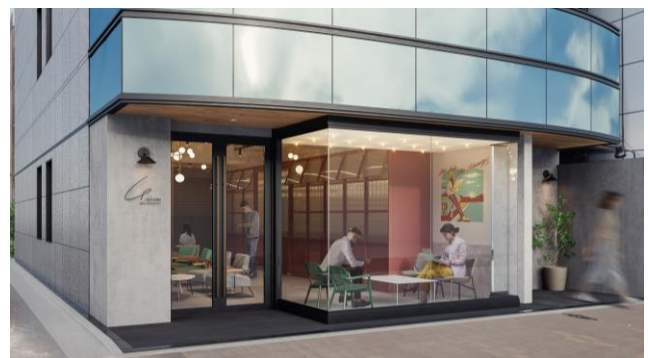
▲GLEAMS NIHONBASHI 外観イメージ