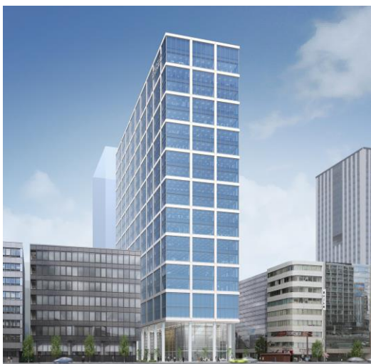
本町サンケイビル 外観

建物利用者の健康性、快適性の維持・増進を支援する建物の仕様、性能、取り組みを評価するツールです。建物内で執務するワーカーの健康性、快適性に直接的に影響を与える要素だけでなく、知的生産性の向上に資する要因や、安全・安心に関する性能についても評価する制度です。