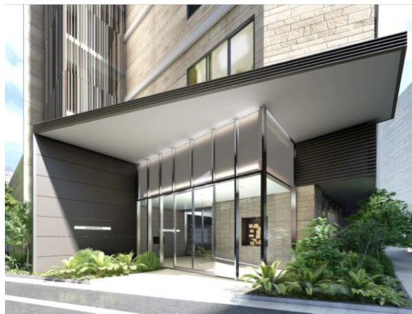
【エントランスイメージ】