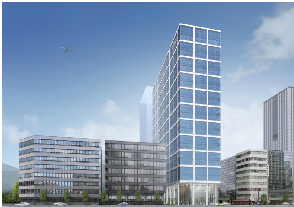
本町サンケイビル