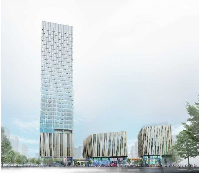
建物外観イメージ