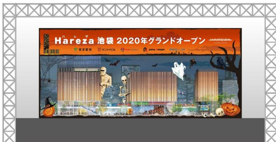
「Hareza 池袋」特設ステージ

尚、このイベントでは、本プロジェクト事業者の東京建物とサンケイビルだけではなく、TOHOシネマズ、ポニーキャニオン、ダウンゴと共に「Hareza 池袋」全体として、池袋エリアを盛り上げて参ります。