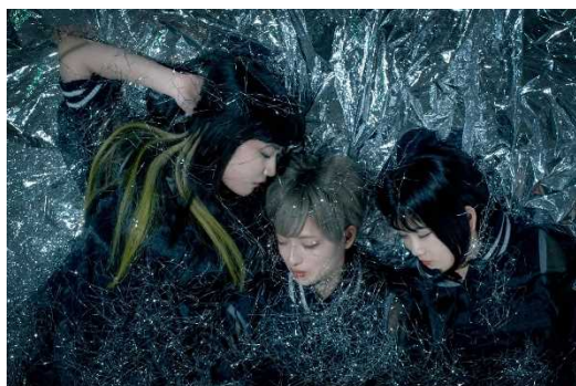
校庭カメラガールドライ