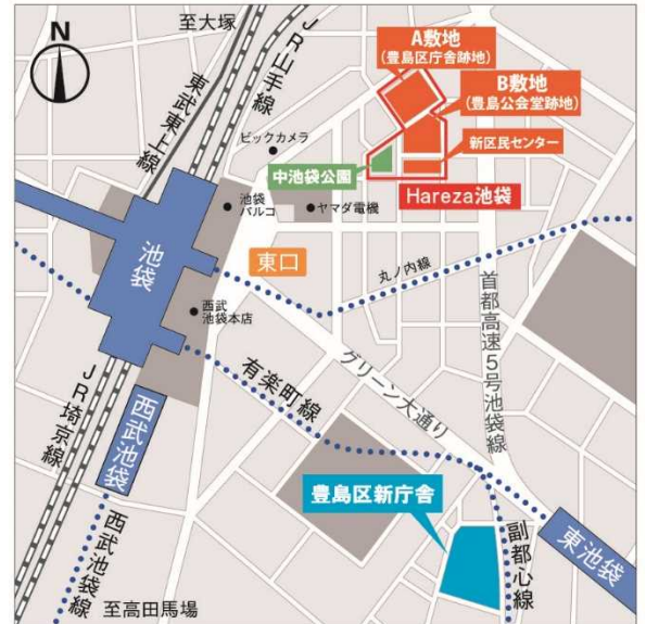
本プロジェクト所在地