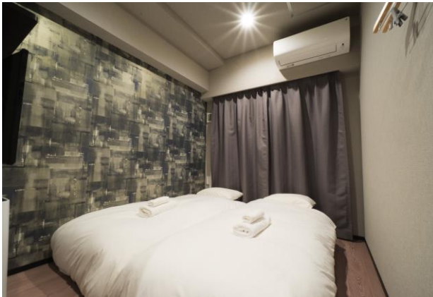
プライベートルーム (2名定員)