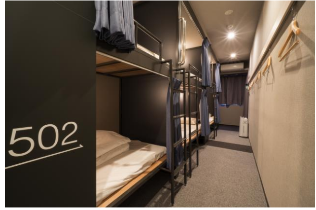
ドミトリー (6名部屋)