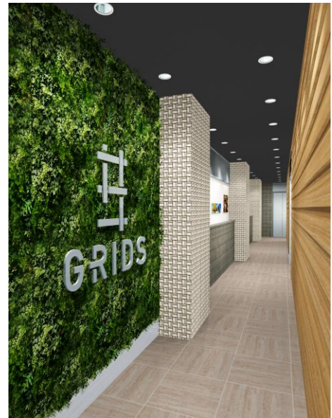
1階 ホステルアプローチ