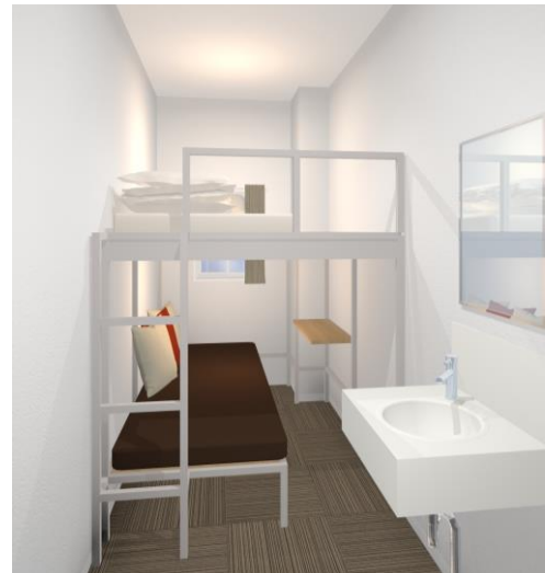
ロフトルーム (1~2名用個室)