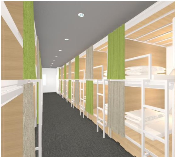
ドミトリールーム