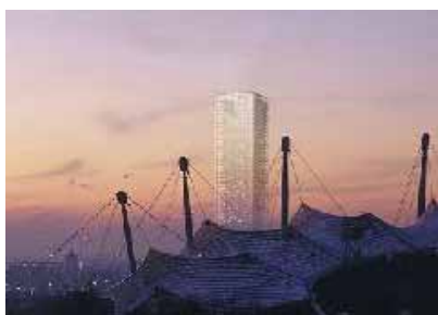
ハイライズ・ビルディング ミュンヘン