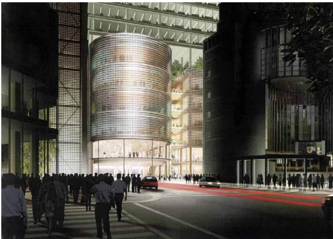
北側からの低層部完成イメージ