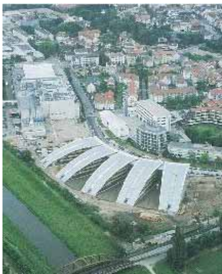
ブルダメディア オフエンブルク