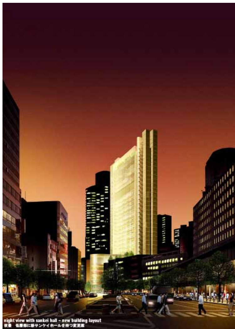
国道二号線からの完成イメージ (夜景)