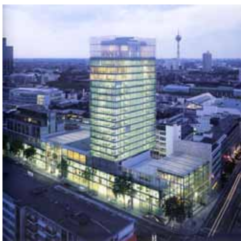
スタツパーカッセ ドュッセルドルフ