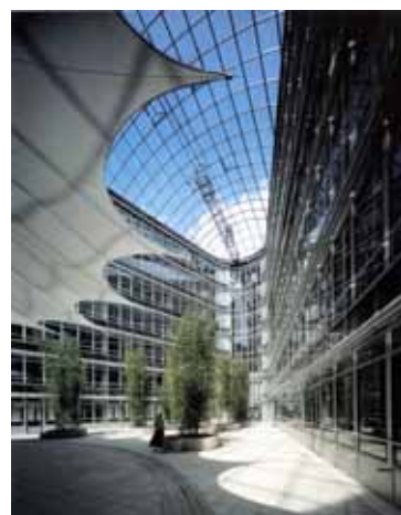
オフィスビル アモンフ ドレスデン