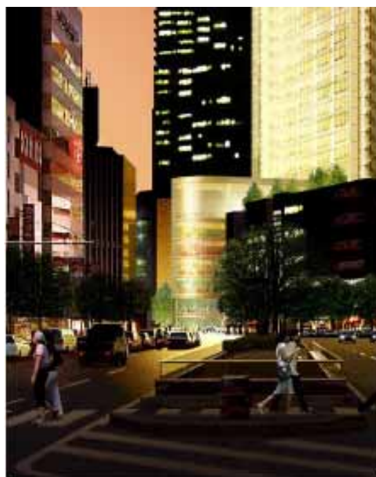
国道二号線からの 「新サンケイホール」 クローズアップ