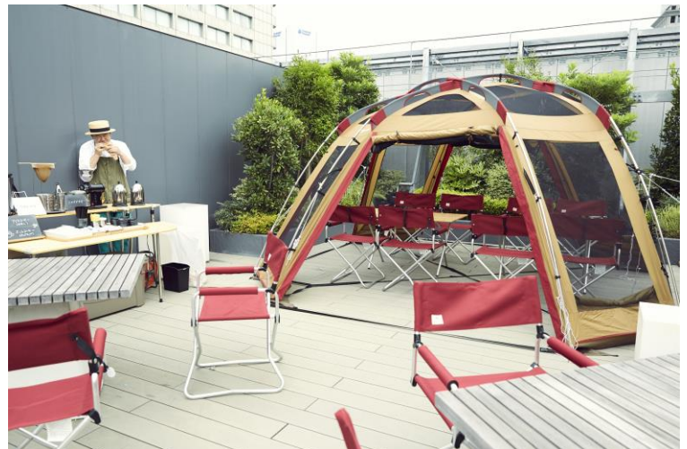
スノーピーク商品による空間演出

サンケイビルは、“進化し続ける企業のためのオフィス”をテーマにしたミッドサイズオフィスビル「S-GATE」シリーズを2015年より展開しています。その中で、昨年度より「ビルも入居テナントの皆様とともに進化していく」ことを目的とし、若手社員を中心としたメンバーで構成された“進化プロジェクトチーム”を立ち上げ、新しい企画・サービス展開を考え、この度実施にいたしました。